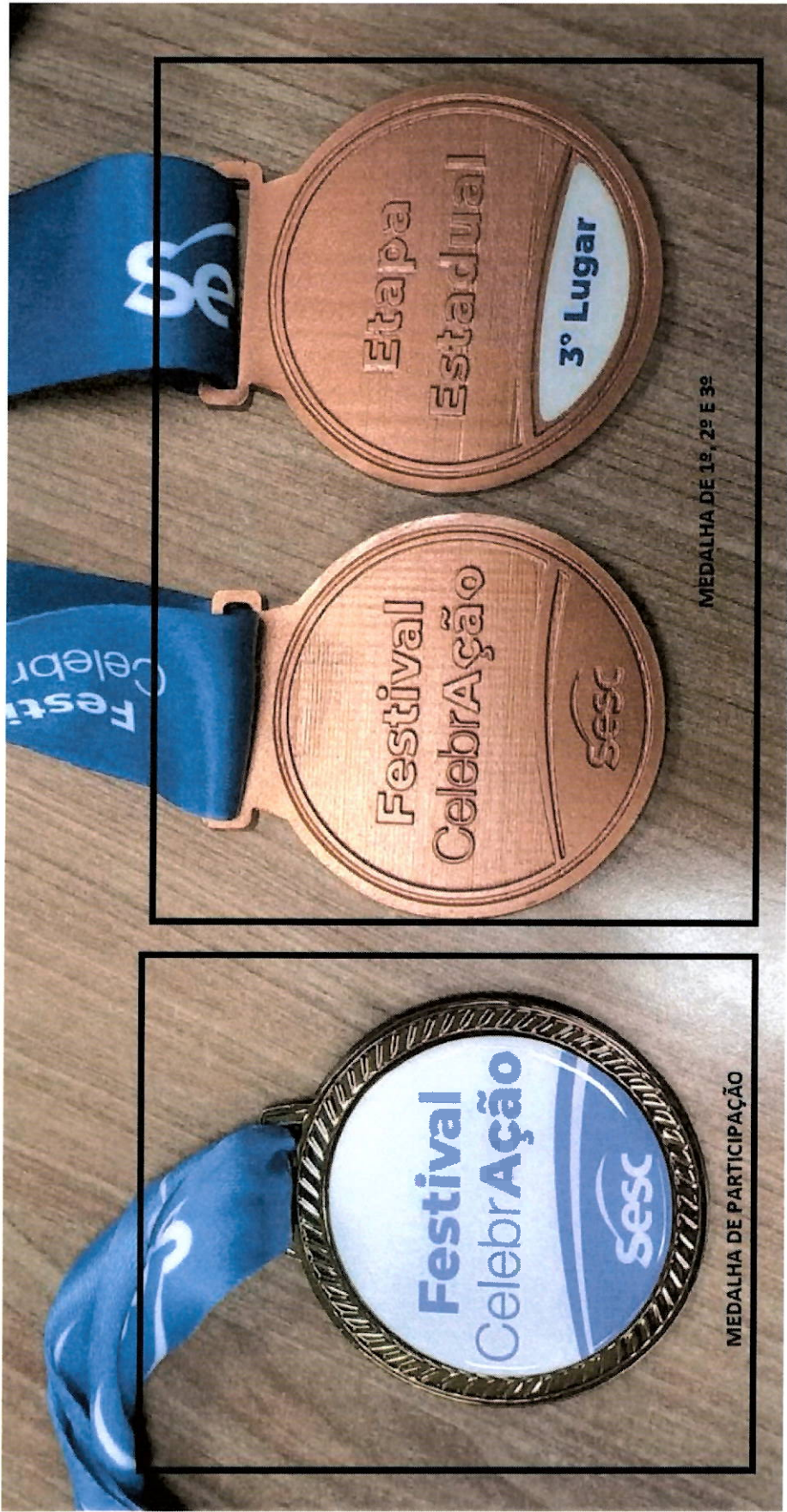
MEDALHA DE 1º, 2º E 3º