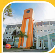
Hotel Sesc Blumenau