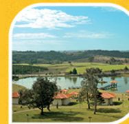
Pousada Rural Sesc Lages