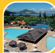
Hotel Sesc Cacupé Florianópolis